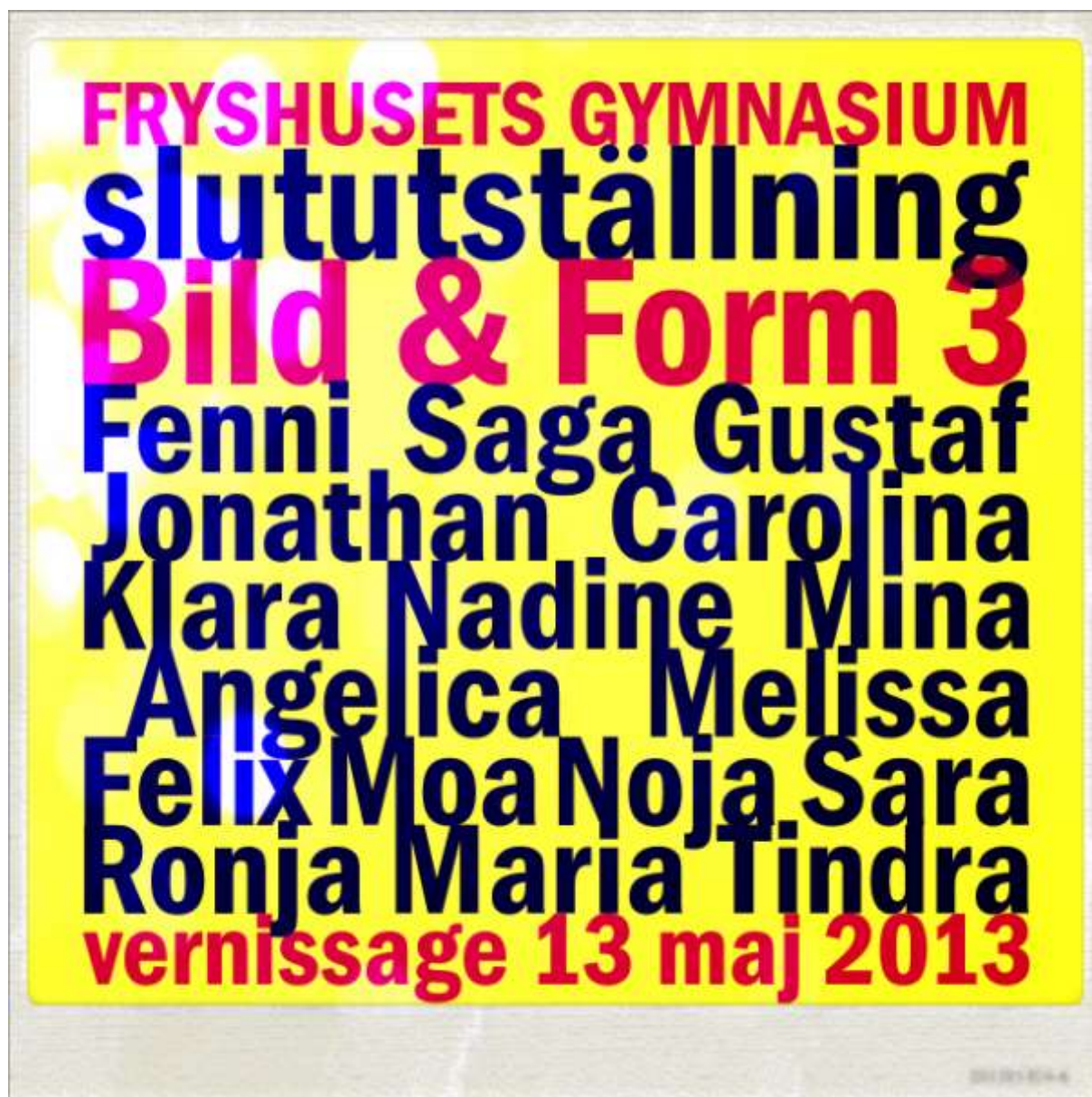
Bild & Form treorna på Fryshuset's Gymnasium ställer ut sin konst i So Stockholm Gallery i Kungsträdgården måndag, tisdag 13-14 maj 2013. Vi har öppet 12:00-20:00 Välkommen!