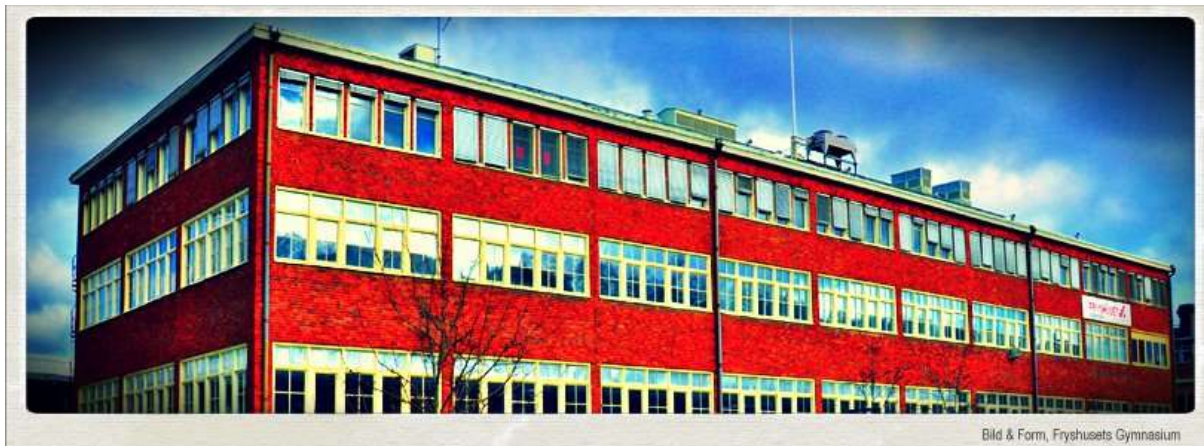
Bild & form på Fryshusets Gymnasium